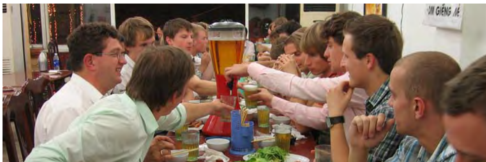
Een typisch Bia-Hoi feestje