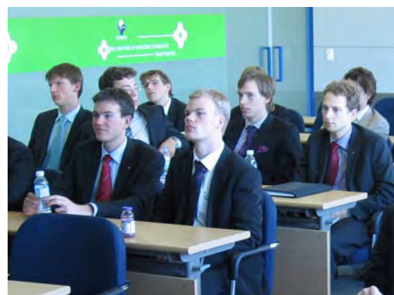
Aandacht voor de presentatie van KITECH

De lunch was op z'n Koreaans: schoenen uit en in kleermakerszit eten aan lage tafeltjes. We aten 'beef bulgogi', een typisch Koreaans gerecht van dunne reepjes bief, taugé en paddestoelen dat we nog vaak als lunch zouden zien.