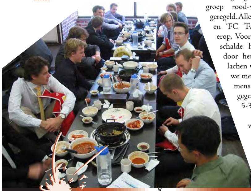
Koreaanse lunch: schoenen uit en op een kussentje zitten

De eerste dag in Seoul stond al in het teken van bedrijven. We bezochten 's ochtends het RFID/USN center. RFID is bekend; USN staat voor Ubiquitous Sensor Networks, alomtegenwoordige sensoren. Het bedrijf heeft enorme test- en ontwikkelafaciliteiten voor RFID-producten en MEMS-sensoren.