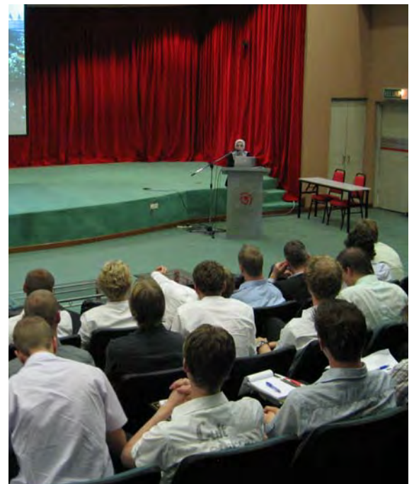
Algemeen praatje van het Technology Park Malaysia