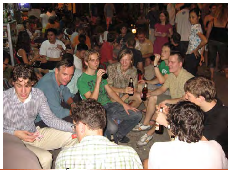
Bier drinken op een kruispunt in Hanoi

Na wat ieder-voor-zich tijd (uitslapen en een wandeling langs de haven) stond de volgende dag weer een hoog buffet op het programma en wel bovenin het Swissotel Equinox. Omdat we hier hebben gebuffetteerd tot het restaurant ons weg wilde hebben, bleef er maar kort tijd over voor een wandeling over Orchard Road, de Champs-Elysées van Singapore. Denk je dat je simpelweg een tunnel in gaat die onder de weg door loopt, zit er een heel winkelcentrum onder de grond... absurd.