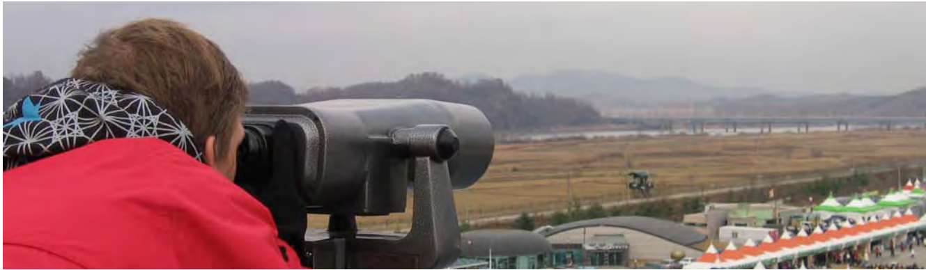
Bezoek aan de Demilitarized Zone, een 4 kilometer brede strook zwaarbewaakt niemandsland tussen Noord- en Zuid-Korea.

instituut van KAIST konden krijgen. Een erg indrukwekkende cleanroom voor een academisch instituut, met onder meer een productiestraat voor CMOS-logica en een afdeling voor nano-bio-onderzoek.