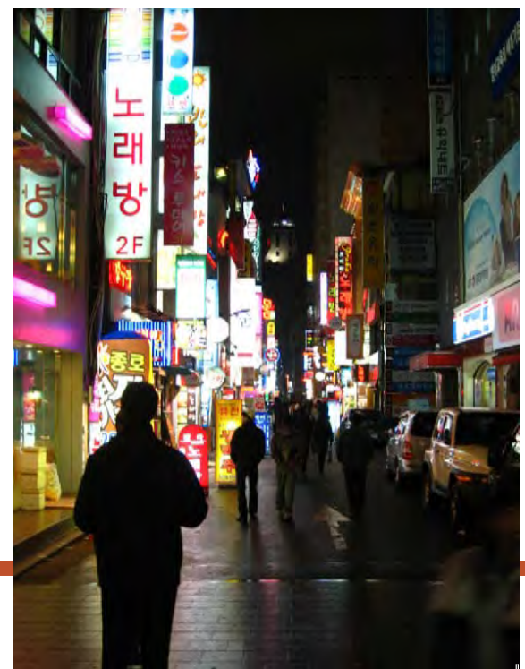
Straatbeeld van Seoul

's Avonds wilden we clubben, maar de clubs stonden niet echt open voor toeristen: de ene