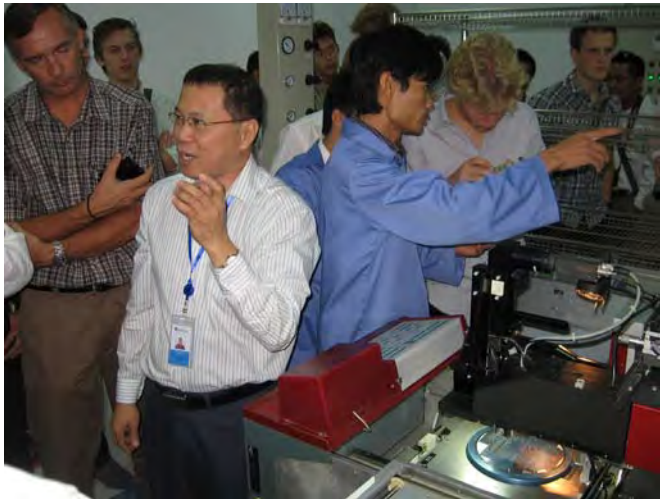
Pacifab: test en packaging van druksensoren

Die avond maakten we kennis met het fenomeen Bia Hoi (letterlijk: vers bier) en zagen dat het goed was. Dit eet- en drinkfeestje met tapjes op tafel maakte de kelen los en er werd gezongen en geproost alsof het niet op kon.