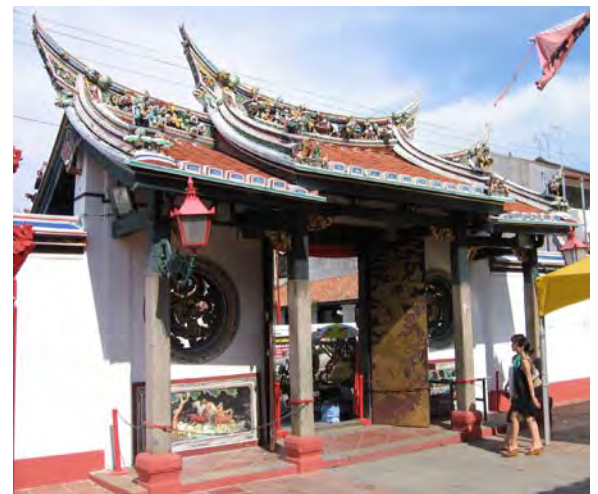
Entree van een Chinese tempel vlakbij Malacca

Met twee uur tijdsverschil kwamen we daar mooi op het heetst van de dag