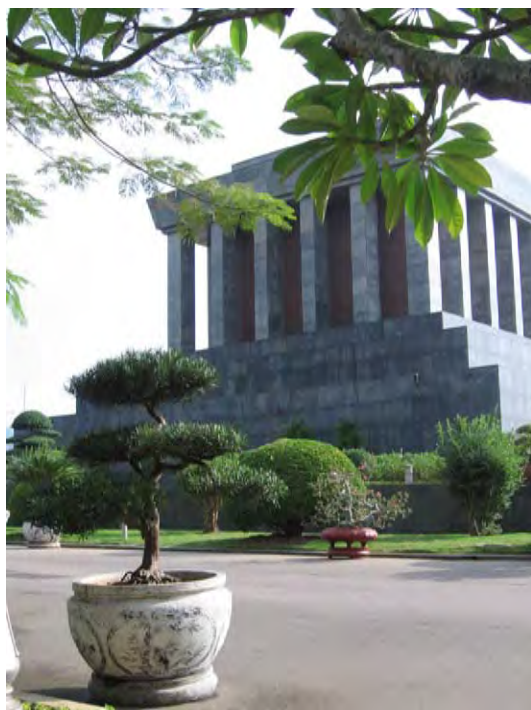
Het Ho Chi Minhmausoleum