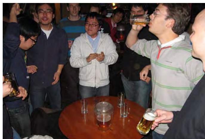
Een onverwacht feestje met KAIST-studenten

's Avonds in Daejon stonden we na een sauna'tje op het punt om uit te gaan, toen we werden opgehaald door wat KAIST-studenten. Er bleek een promotiefeestje te zijn in de stad, waar wij ook welkom bij waren. En zo werd het een gezellige avond met poolen, tafelvoetballen en bierestafettes met de Koreanen.