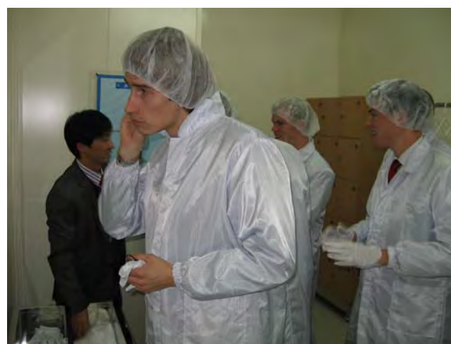
Klaar voor een rondleiding langs het NanoFab van KAIST