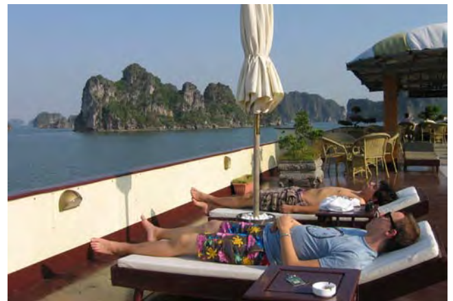
Relaxen op de Ha Long Bay-cruise

's Middags bezochten we Pacifab, een startend bedrijf dat druksensoren van andere bedrijven test en in een package stopt. We kregen het voor elkaar met ons enthousiasme de hele werkvloer van een man of 30 een kwartiertje stil te leggen.